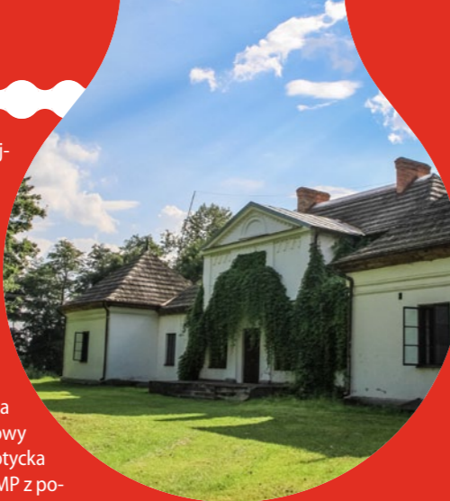
Dwór w Skotnikach

Sandomierz. Jedno z najpiękniejszych miast w Polsce leży na siedmiu sąsiadujących ze sobą wzgórzach nad Wisłą. W obrębie Starego Miasta znakomicie zachował się średniowieczny układ urbanistyczny, a także liczne zabytki z różnych epok – kamienne, kościoły i budynki użyteczności publicznej. Najwspanialsze i najbardziej znane to: gotycka Brama Opatowska, ratusz z połowy XIV w. z renesansową attyką, gotycka bazylika katedralna Narodzenia NMP z polichromiami z 1421 r. oraz romański kościół św. Jakuba z 1. dekady XIII w. wraz z przyległym klasztorem dominikańskim z lat 1226–50. Warto też zwiedzić podziemną trasę turystyczną, wybrać się na rejs stat-