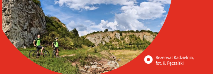
Rezerwat Kadzielnia

z akcji partyzan- tów, w sierpniu 1944 r. Niem- cy spacyfikowali i spalili miejsc- owość. Warto tu zwiedzić kościół z 1221 r., przebudowany dwu- krotnie w XVII w. i w 1912 r.