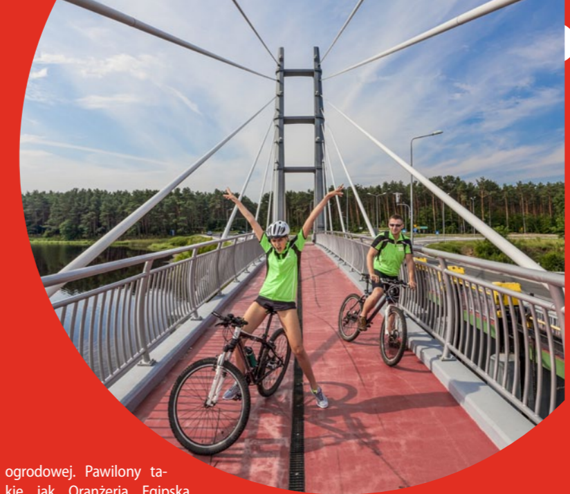
Kładka w Sielpi Wielkiej

Końskie. Miasto na połu- dniowo-wschodnim skraju Wzgórz Opoczyńskich po- wstało prawdopodobnie już w XI w. Warto tu zwi- edzić klasycystyczny zespół pałacowo-parkowy słyną- cy z tzw. małej architektury