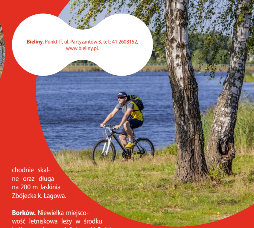
Bieliny. Punkt IT, ul. Partyzantów 3, tel.: 41 2608152, www.bieliny.pl .

Cisowsko-Orłowski Park Krajobrazowy. Znajdujący się na południe od Gór Świętokrzyskich i na południowy wschód od Kielc park krajobrazowy został utworzony w celu ochrony urokliwego krajobrazu oraz różnorodnych form życia roślinnego i zwierzęcego. Na terenie parku znajdują się 4 rezerваты przyrody („Białe Ługi”, „Cisów”, „Słopiec” i „Zamczysko”), w których występują 52 gatunki roślin chronionych (z czego 15 to gatunki niezwykle rzadkie). Ochronie podlegają także znajdujące się tu torfowiska i ponad 200-letnie drzewostany jodłowo-bukowo-dębowe. Atrakcjami parku są również liczne wy-