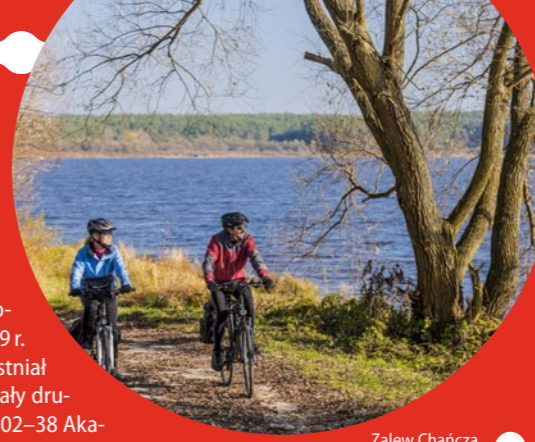
Zalew Chańcza

Zalew Chańcza. To zbiornik retencyjny na rzece Czarna Staszowska, usytuowany na południe od Rakowa. Powierzchnia lustra wody akwenu to 340 ha, a jego głębokość na dominującym obszarze nie przekracza 5 m. Zalew od momentu utworzenia stał się dużą atrakcją turystyczną re-