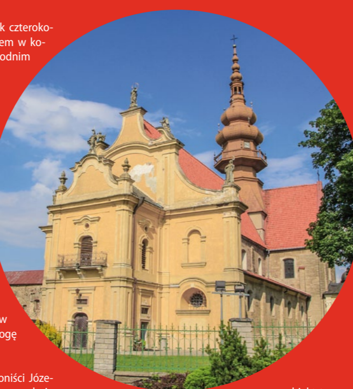
Klasztor w Koprzywnicy

Klimontów. Nad zabudową leżącą na Wyżynie Sandomierskiej wsi górują wieże i kopuła barokowej kolegiaty św. Józefa zaprojektowanej przez Wawrzyńca Senesę. Ta majestatyczna budowla jest jednym z najwspanialszych XVII-wiecznych zabytków sakralnych w Polsce. W Klimontowie warto zobaczyć także poddominikański kościół św. Jacka z lat 1617–20 i zabudowania dawnego klasztoru dominikanów oraz neoklasykistyczną synagogę wzniesioną w roku 1851.