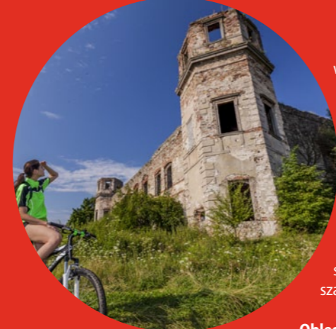
Ruiny pałacu w Podzamczu Piekoszowskim

Podzamcze Piekoszowskie. W tej niewielkiej wsi na zachód od Kielc znaj- dują się ruiny wspaniałej barokowej re- zydencji rodziny Tarłów herbu Topór. Budowla została wzniesiona w latach 1649–55 na wzór Pałacu Biskupów Kra- kowskich w Kielcach. W narożach pałacu wznoszą się cztery sześcioramienne baszty: w północnych znajdowały się pomieszcze- nia administracyjne, zaś w południowych umiejscowiono klatki schodowe.