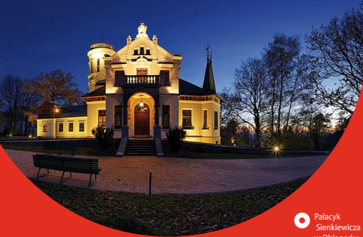
Pałacyk Sienkiewicza w Oblęgorku, fot. K. Pęczalski

walorów krajoznawczych, przyrod- niczych i kulturowych tych tere- nów (w jego granicach znajdują się pozostałości Staropolskiego Zagłębia Przemysłowego – m.in. ruiny zakładów wielkopi- cowych w Samsonowie i Bobrzy). Najbardziej znanym obiektem na terenie parku jest dąb Bartek we wsi Zagnańsk – jedno z najstar- szych drzew w Polsce, którego wiek szacuje się na co najmniej 1200 lat.