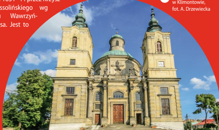
Kolegiata w Klimontowie

Ujazd. W Ujeździe znajduje się zamek Krzyżtopór, wybudowany w latach 1631–44 przez Krzysztofa Ossolińskiego wg projektu Wawrzyńca Senesę. Jest to