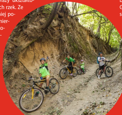
Wąwóz św. Jadwigi

Świętokrzyski odcinek Green Velo to wyjątkowy etap szlaku. Z położonego na wzgórzach Sandomierza trasa prowadzi w górę Wisły do niewielkich Skotnik, pozwalając podziwiać nizinne krajobrazy ukształtowane przez najwspanialszą z polskich rzek. Ze Skotnik jedzie się przez coraz mocniej pofałdowane tereny Wyżyny Sandomierskiej do Klimontowa i zamku Krzyżtopór w Ujeździe, a dalej pośród wznie- sień z widokami na główne pasmo Gór Świętokrzyskich do Kielc, Oblegorka, Sielpi Wielkiej i Końskich. Pomimo pofałdowania terenu ten odcinek trasy nie powinien przysporzyć problemów nawet osobom mniej zaawansowanym w turystyce rowerowej.