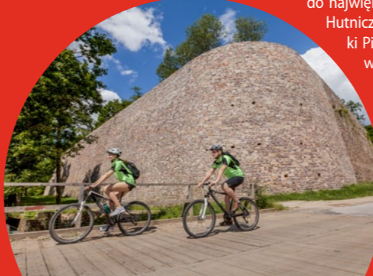
Ruiny huty w Bobrzy

hucie z czasów Królestwa Polskiego. Za- kład ten miał wytwarzać tyle surówek, ile wszystkie inne huty Królestwa razem wzięte. Składał się z pięciu wielkich pieców o wysokości 18 m, a dla jego zabezpiecze- nia wybudowano kamienny mur oporowy o długości niemal 500 m i wysokości 15 m. Budowę huty przerwał wybuch powstania listopadowego w 1830 r., ale pozostałości nieukończonych zakładów do dziś wzbu- dzają podziw.