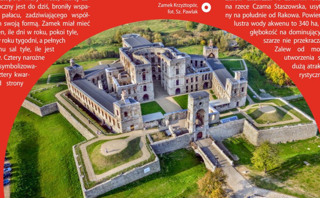
Zamek Krzyżtopór

obiekt typu palazzo in fortezza , co oznacza „pałac w fortecy”. Na bramie wejściowej do zamku widnieje krzyż i godło rodu Ossolińskich – topór (stąd nazwa zamku: Krzyżtopór). Mury i fosa, której zarys widoczny jest do dziś, broniły wspinałego pałacu, zadziwiającego współczesnych swoją formą. Zamek miał mieć tyle okien, ile dni w roku, pokoi tyle, ile jest w roku tygodni, a pełnych przepychu sal tyle, ile jest miesięcy. Cztery narożne baszty symbolizowały zaś cztery kwartały. Od strony