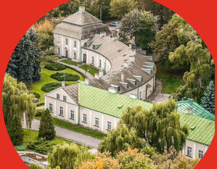
Zespół pałacowo- parkowy w Końskich

ogrodowej. Pawilony ta- kie jak Oranżeria Egipska, Świątynia Grecka, gloriety itp. pocho- dzą z 1. poł. XIX w. Sam pałac powstał w la- tach 40. XVIII w. W centrum miasta wzno- sił się neogotycka kolegiata św. Mikołaja i św. Wawrzyńca, której historia się- ga XIII w.