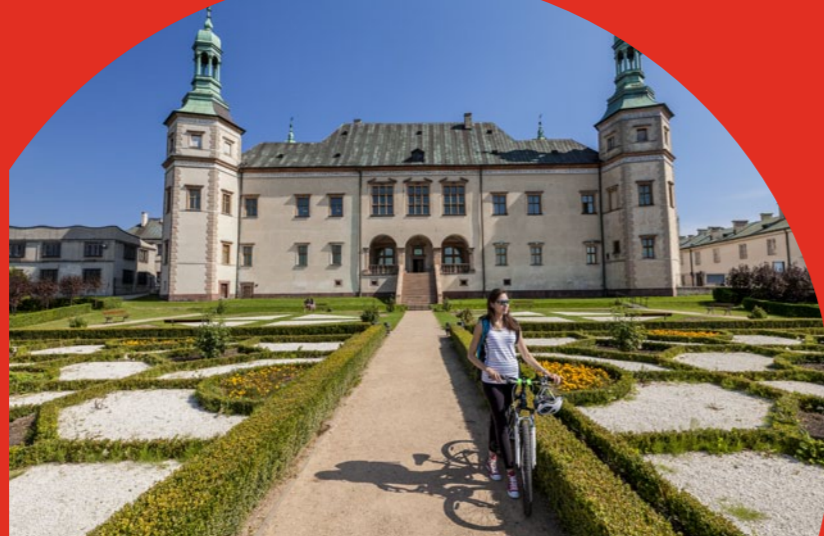
Pałac Biskupów Krakowskich w Kielcach

Kielce. W stolicy województwa świętokrzyskiego znajduje się wie- le atrakcji. Warto tu udać się na najwyż- szy punkt miasta, czyli wzgórze Telegraf, na które można również wjechać wycią- giem krzeselkowym. Na stokach pobliskiej Pierścienicy znajduje się wyciąg narciarski, a u jej podnóża Stadion Leśny – popu- larny kompleks parkowo-leśny. Warto też odwiedzić jeden z kieleckich rezerwa- tów przyrody (np. „Ślichowice”, „Kadziel- nię” czy „Wietrznię” z nowoczesnym Cen- trum Geoedukacji). W centrum odnaj- dziemy liczne muzea, a przede wszystkim