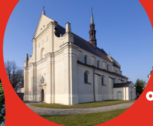
Kościół św. Trójcy w Rakowie, fot. K. Pęczalski

Koprzywnica. W pobliżu szlaku warto zobaczyć pochodzący z XIII w. pocysterski klasztor w Koprzywnicy. Najwięcej emocji u zwiedzających wzbudzą zachowane