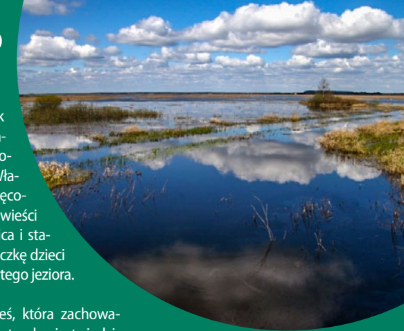
Zalew Siemianówka

lik zwyczajny i perkozek zwyczajny). Tereny sąsiadujące z akwenem stanowią także ostoję losia. Właśnie na Siemianówce kręcono sceny do filmu „Opowieści z Narnii. Lew, czarownica i stara szafa” ukazujące ucieczkę dzieci przez środek zamrzniętego jeziora.