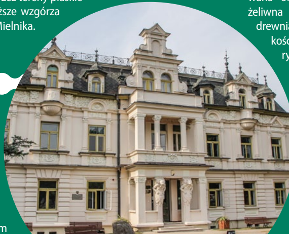
Pałac Buchholtzów w Supraślu

Święta Woda. Sanktuarium Matki Boskiej Bolesnej w Wasilkowie-Swiętej Wodzie to popularne miejsce pielgrzymkowe. Miejsce kultu istniało tu już w 1. poł. XVIII w., za sanktuarium zostało oficjalnie uznane w 1997 r. Poza kościołem znajdują się tu: grota z cudownym źródłem (obmywszy się w nim