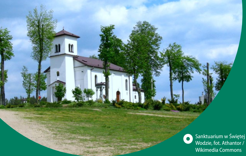
Sanktuarium w Świętej Wodzie, fot. Athantor / Wikimedia Commons

Supraśl. Punkt Usług Turystycznych „Bukowisko”, ul. Piłsudskiego 64, tel.: 85 7102470, turystyka@powiatbialostocki.pl.