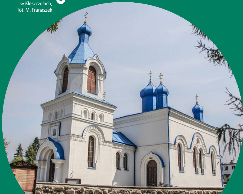
● Cerkiew Zaśnięcia NMP w Kleszczelach

Siemiatycze. Miasto nad rzeką Kamionką, dopływem Bugu, pełne jest cennych zabytków. Można tu zobaczyć dawny klasztor misjonarzy, dawną bożnicę, murewaną cerkiew prawosławną Świętych Apostołów Piotra i Pawła z 1866 r. oraz domy klasycystyczne. Dość niezwykłymi obiektami są figury sfinksów stojące w miejscu dawnej