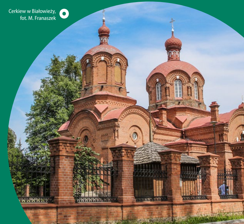
Cerkiew w Białowieży

Białowieża. Spora wieś, która zachowała klimat dawnego miasteczka, jest siedzibą dyrekcji Białowiejskiego Parku Narodowego. Można się tu wybrać do Rezerwatu Pokazowego Żubrów, obejrzeć zabytkowe świątynie (cerkiew i kościół) oraz budynki świeckie (m.in. te mieszczące Ośrodek Edukacji Przyrodniczej BPN) albo spędzić miło czas w Parku Pałacowym powstałym na przełomie XIX i XX w. przy myśliwskiej rezydencji carów Rosji. Rośnie w nim