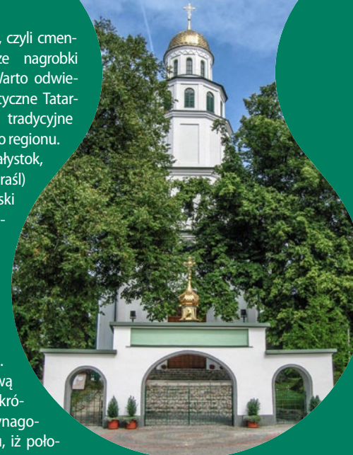
Cerkiew w Gródku

Gródek. Niegdyś duże miasteczko, a obecnie duża wieś to kolejny przykład wielokulturowej podlaskiej miejscowości. Przed II wojną światową w krajobrazie Gródka królowały drewniane synagogi, co wynikało z faktu, iż połowę jego mieszkańców stanowili Żydzi. Wedle udokumentowanych źródeł 1380 z nich zostało zgładzonych w Treblince. Dziś o społeczności żydowskiej w Gródku przypomina