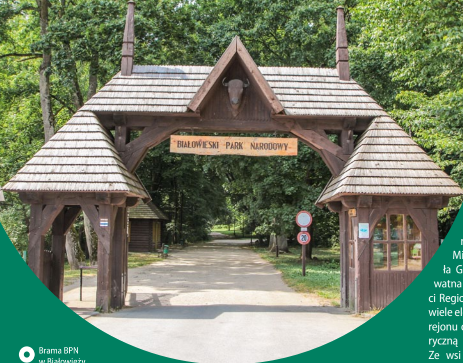
● Brama BPN w Białowieży, fot. M. Franaszek

Białowieży Park Narodowy. Park o powierzchni ponad 10,5 tys. ha chroni najlepiej zachowany fragment Puszczy Białowieżskiej, ostatniego na niżu Europy naturalnego lasu liściastego i mieszanego o charakterze pierwotnym, nieprzekształconego w żaden sposób przez człowieka. Symbolem parku jest żubr. Zarówno Białowieży Park Narodowy, jak i jego białoruski odpowiednik, zostały wpisane na listę UNESCO. Przez park prowadzi zabytkowa linia kolejki wąskotorowej z Hajnówki do Topiła.