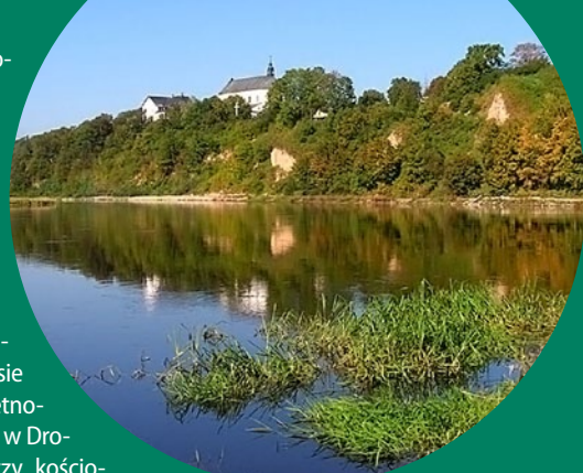
● Widok na Górę Zamkową w Drohiczynie, fot. J. Bryła / Wikimedia Commons

Drohiczyn. Leżący nad Bugiem Drohiczyn to jedno z najbardziej cennych kulturowo miast wschodniej Polski. W okresie jego największej świetności, tj. w 1. poł. XVII w. w Drohiczynie istniały trzy kościoły, po jednej cerkwi greckokatolickiej i prawosławnej oraz aż cztery klasztory różnych wyznań. W mieście funkcjonował także szpital i szkoła. Do najcenniejszych zabytków należą dziś zespoły poklasztorne jezuitów, franciszkanów i benedyktynów oraz dawna cerkiew unicka św. Mikołaja z ciekawym wyposażeniem wnętrza. Warto zwiedzić także dwa muzea (Diecezjalne oraz Regionalne) oraz grodzisko na Górze Zamkowej.