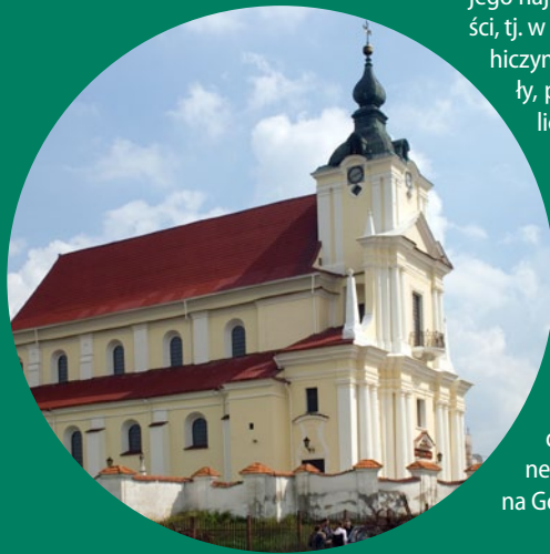
● Kościół w Siemiatyczach

bramy wjazdowej prowadzącej do pałacu księżnej Anny Jabłonowskiej.