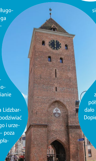
Brama Targowa w Elblągu

Odcinek szlaku pomiędzy Kępinami Wielkimi nad Nogatem a Lidzbarkiem Warmińskim obfituje w malownicze widoki. Jadąc, można podziwiać płaskie krajobrazy Żuław, szeroko rozlane wody Zalewu Wiślanego i urzekające spokojem warmińskie wioski. Na niemal całym odcinku – poza częścią wiodącą przez Wysoczyznę Elbląską – szlak prowadzi po płaskim terenie i jest łatwy do pokonania.