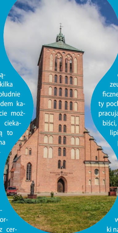
Bazylika św. Katarzyny Aleksandryjskiej w Braniewie

Braniewo. W leżą- cym nad Pasłęką, kilka kilometrów na południe od granicy z obwodem ka- linińskim mieście moż- na zobaczyć kilka cieka- wych zabytków. Są to m.in. odbudowana ze zniszczeń wojen- nych monumentalna bazylika św. Katarzyny Alek- sandryjskiej, baro- kowy kościół Krzy- ża Świętego, neogo- tycki budynek dwor- ca kolejowego oraz cer- kiew greckokatolicka, będą- ca pierwotnie gotyckim kościołem Świę- tej Trójcy.