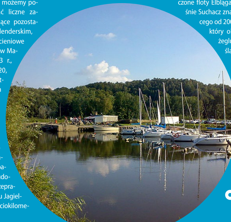
Port w Suchacz, fot. Sylwester M. Jarkiewicz

Bielnik Drugi. W niewielkiej miejscowości na Żuławach Elbląskich warto zobaczyć most na Nogacie, zbudowany w miejscu dawnej przeprawy promowej, i ujście Kanału Jagiellońskiego do Nogatu. Sześciokilome-