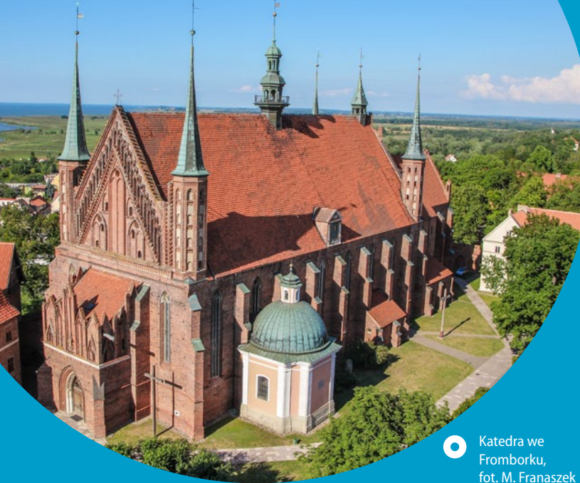
Katedra we Fromborku

Frombork. Na Wzgórzu Katedralnym we Fromborku znajduje się jedna z najwspanialszych budowli sakralnych w Polsce: bazylika archikatedralna, wraz z dawnym pałacem biskupim opasana murami na podobieństwo warownego zamku. Na tym samym wzniesieniu warto zobaczyć też m.in. dawną dzwonnice, zwaną Wieżą Radziejowskiego, w której umieszczono wahadło Foucaulta, Wieżę Kopernika, użytowaną przez sławnego astronoma, czy też kanonie. W innych częściach miasta także znajduje się wiele ciekawych zabytków, takich jak choćby dawny kompleks szpitalny św. Ducha. Jednym z symboli Fromborka jest ceglana wieża wodociągowa z XIV–XVI w., za-