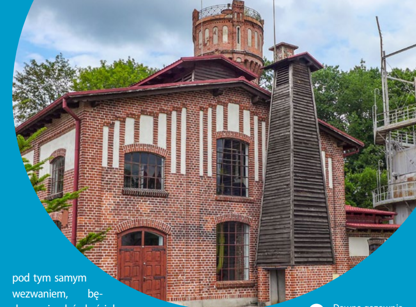
Dawna gazownia w Górowie Iławeckim

Wielochowo. Niewielka miejscowość oddalona jest o kilkanaście minut jazdy rowerem od Lidzbarka Warmińskiego. Jej największymi atrakcjami są plaża i kąpie- lisko; duże moło wydziela dwa zamknię- te, prostokątne obszary pływackie – dla dzieci i dla dorosłych.