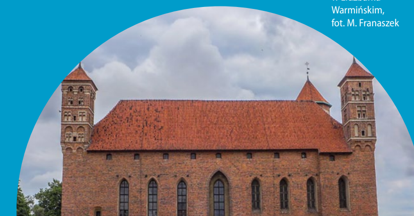
Zamek biskupów w Lidzbarku Warmińskim

wreszcie zachowane na dużym odcinku mury obronne. Warto zobaczyć także zabyt- ki z późniejszych okresów, jak choćby barokowo-kl- asycystyczną oranżerię Krasickiego.