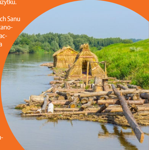
○ Tratwy flisackie w Ulanowie

rowego. W miasteczku warto też zobaczyć kościół cmentarny św. Trójcy z ciekawą polichromią iluzoryczną z XVIII w. oraz spory kirkut z zachowanymi niemal 150 macewami, z których najstarsza pochodzi z 1825 r.