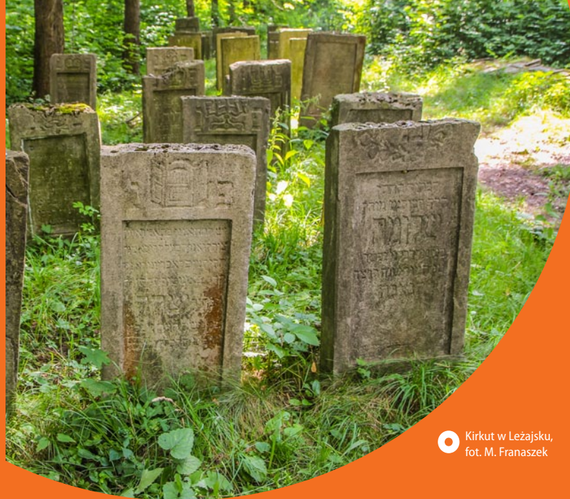
○ Kirkut w Leżajsku

uprawne i bardzo łatwy dostęp do dobrej jakościowo gliny sprawiły, że wyrób garnków stał się tu zajęciem powszechnym, którym się trudniły całe rodziny. Warto zwiedzić powstałą w 2001 r. Zagrodę Garncarską, tworzoną przez kilka XIX-wiecznych budynków mieszkal-