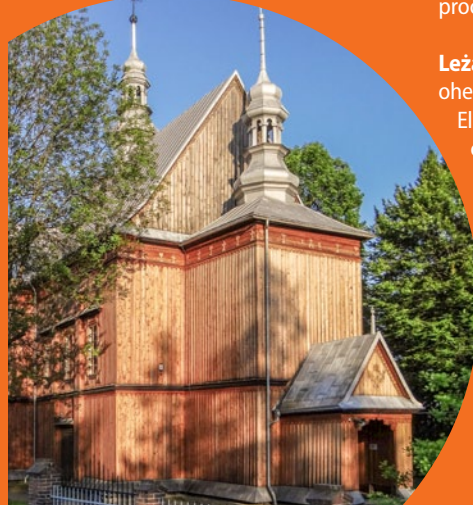
○ Kościół w Krzeszowie, fot. Zbigniew Czernik / Wikimedia Commons

nych oraz warsztat z piecem do wypalania ceramiki. Można tu prześledzić cały proces produkcji glinianych naczyń.