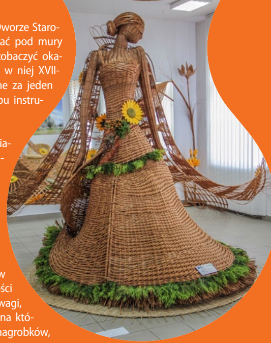
○ Centrum Wikliniarstwa w Rudniku nad Sanem

Ulanów. Lokalizacja miasta w widłach Sanu i Tanwi sprawiła, iż już od XVII w. stanowiło bardzo ważny ośrodek flisactwa. Dziś nad brzegiem Sanu można oglądać zrekonstruowane kilka lat temu tradycyjne tratwy flisackie. Przy sąsiadujących z rynkiem ulicach stoją liczne drewniane domy flisackie – są to charakterystyczne niewielkie budynki ustawione szczytami do drogi. Tradycje flisackie w Ulanowie znalazły się jako jedne z pierwszych w Polsce na krajowej liście niematerialnego dziedzictwa kultu-