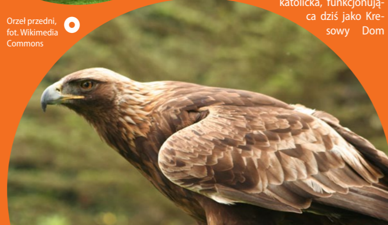
Orzeł przedni, fot. Wikimedia Commons

Park Krajobrazowy Pogórze Przemyskiego. Znajdujący się na południowy zachód od Przemysła park powstał w 1991 r. i jest jednym z największych parków krajobrazowych w Polsce. Chroni suche doliny, torfowiska i zespoły leśne. Na terenie parku żyją liczne gatunki zwierząt (m.in. rysie, niedźwiedzie, żbiki, jelenie karpackie, orły przednie, puszczyki uralskie i orły cesarskie) oraz roślin (bluszcz pospolity, wawrzynek wilczełyko czy ziemowit jesienny). Najślynn-