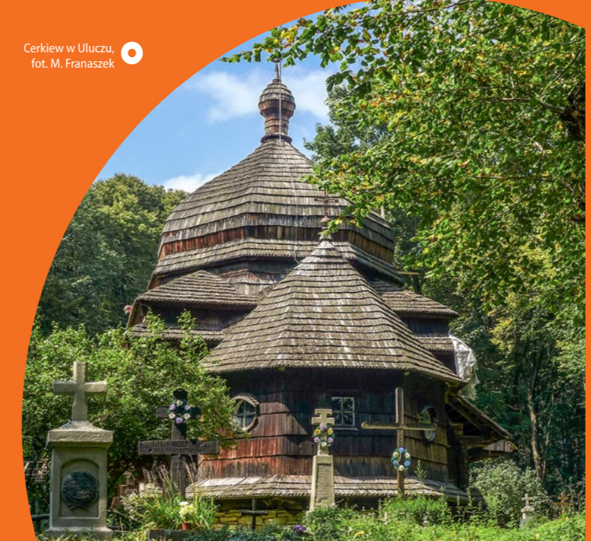
Cerkiew w Uluczu