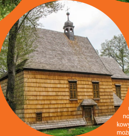
Kościół św. Katarzyny w Bachórzcu

Dąbrowka Starzeńska. Znajdują się tu ruiny XV-wiecznego zamku rodziny Kmiców otoczone sporym parkiem z licznymi starymi drzewami oraz aleją grabową. Podczas powstania styczniowego w zamku przebywali przywódcy zrywu: gen. Marian Langiewicz i gen. Ludwik Mierosławski. Za czasów Starzeńskich, którzy przebudowali zamek w XIX w., znajdowała się w nim duża biblioteka i kolekcja dzieł