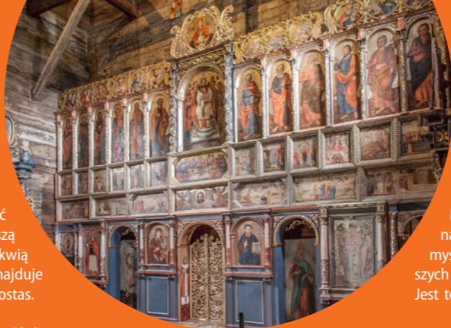
Cerkiew w Radrużu

Radruż. W małej wsi leżącej tuż przy granicy z Ukrainą znajduje się wspaniały kompleks cerkiewny o charakterze obronnym, który w 2013 r. znalazł się na liście UNESCO. Cerkiew św. Paraskewy, stanowiąca centralną część kompleksu, jest najstarszą istniejącą drewnianą cerkwią w Polsce. W świątyni znajduje się niezwyklej urody ikonostas.