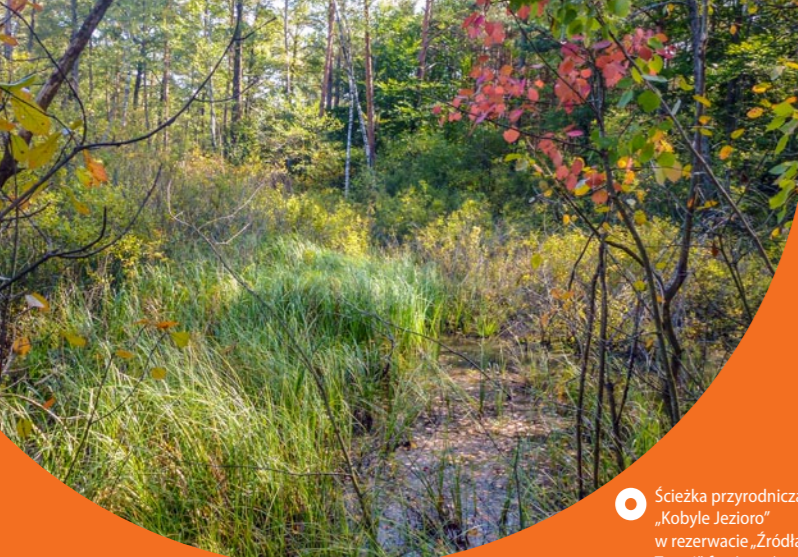
Scieżka przyrodnicza „Kobyle Jezioro” w rezerwacie „Źródła Tanwi”

mię artystyczną dla utalentowanej młodzieży z Europy Środkowej i Wschodniej. Poza pałacem w Narolu warto zobaczyć XIX-wieczny ratusz oraz XIX-wieczną unikalną cerkiew Ofiarowania Matki Bożej w Świątyni.