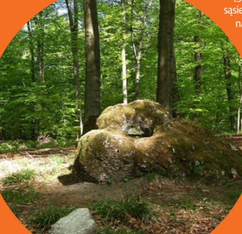
Kamień w Świątyni Słońca

Chotyniec. W leżącej na północny wschód od Przemyśla wsi znajduje się jedna z najpiękniejszych drewnianych cerkwi w Polsce – pw. Narodzenia Przenajświętszej Bogurodzicy z 1615 r. Wraz