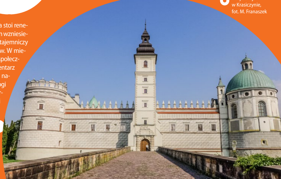
Rezydencja w Krasiczynie, fot. M. Franaszek

Krasiczyn. W położonym na zachód od Przemyśla Krasiczynie znajduje się jeden z najwspanialszych zabytków