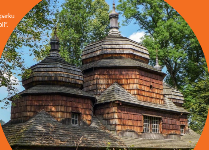
Cerkiew w Piątkowej

Dubiecko. Ta duża wieś, niegdyś miasteczko, przeszła do historii jako jeden z bardziej znanych ośrodków reformacji w Polsce i miejsce, gdzie chroniły się osoby ekskomunikowane w Kościele katolickim. W miejscowości znajduje się kilka obiektów wartych zobaczenia: pałac Krasickich w latach 1771–90 przebudowany z istniejącego tu wcześniej zamku (to tu urodził się Ignacy Krasicki), otaczający go park, dawna cerkiew greckokatolicka, funkcjonująca dziś jako Kresowy Dom