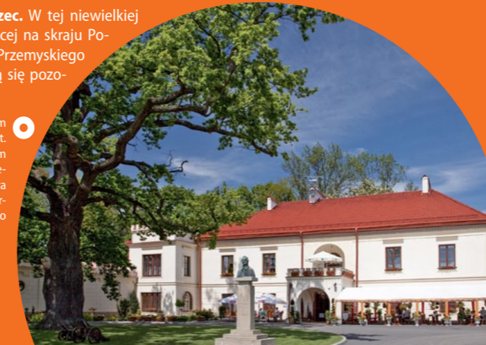
W centrum Dubiecka