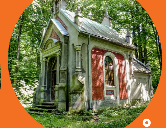
Kaplica grobowa Starzeńskich w Dąbrowce Starzeńskiej, fot. Bogdan Śniezek / Wikimedia Commons