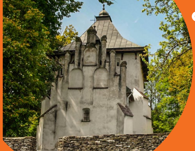
Cerkiew w Posadzie Rybotyckiej

niejsze rezerwy na obszarze parku to „Kopystanka” i „Przełom Hołubli”.