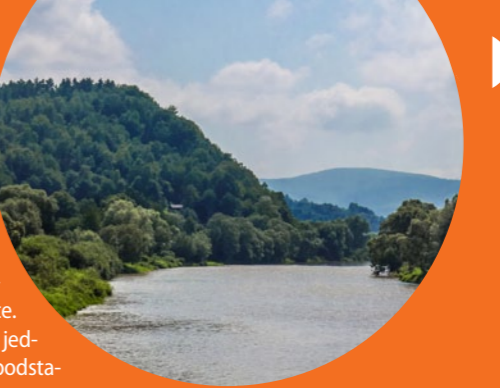
San w rejonie Dynowa

Dynów. Miasto to dało nazwę Pogórze Dynowskiemu ciągnącemu się od Doliny Sanu (na wschodzie) do Wisłoka. Atrakcją miejscowości jest kursująca między Dynowem a Przeworskiem kolejka wąskotorowa. Przejeżdża ona przez jedyny na liniach wąskotorowych tunel – mający 602 m długości.