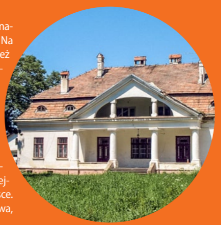
Dwór w Stubnie, fot. Wojciech Pysz / Wikimedia Commons

zachowało się również kilkanaście domów z początku XX w. Na terenie Stubna znajduje się też 13-hektarowy rezerwat chroniący stanowiska szachownicy kostkowej – rzadkiej, pięknie kwitnącej byliny z rodzaju liliowatych.