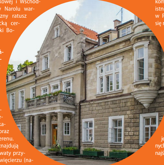
Pałac w Horyńcu-Zdroju, fot. Wojciech Pysz / Wikimedia Commons

interesujące są również ślady mieszania się kultur Wschodu i Zachodu, widoczne tu przede wszystkim w architekturze drewnianych cerkwi.