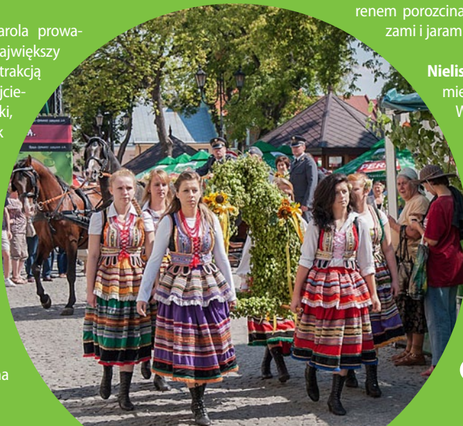
Chmielaki Krasnostawskie

Odcinek szlaku od Chełma do Narola prowadzi m.in. wzdłuż rzeki Wieprz nad największy w regionie zalew w Nieliszu. Główną atrakcją tego etapu jest Roztocze – jeden z najciekawszych krajobrazowo obszarów Polski, na którym utworzono Roztoczański Park Narodowy. Szlak odwiedza interesujące miasteczka, takie jak Szczebrzeszyn czy Zwierzyniec, pozwala zobaczyć malownicze stawy Echo, urokliwe kamieniołomy w okolicy Józefowa i rzekę Tanew pełną niewielkich malowniczych wodospadów zwanych szumami. Trasa na tym odcinku biegnie pośród pól i lasów. Choć na Roztoczu teren jest pofałdowany, jazda nie stanowi wyzwania kondycyjnego, a rowerzysta może skupić się na podziwianiu wspaniałych widoków.