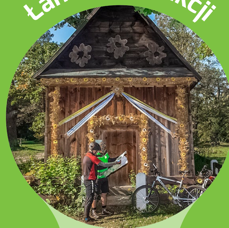
Rezerwat Czartowe Pole, fot. M. Tarajko

Górecko Kościelne. Najcenniejszym zabytkiem wsi położonej wśród lasów Puszczy Solskiej jest stojący w centrum miejscowości modrzewiowy kościół z 1768 r., wzniesiony na pamiątkę objawienia św. Stanisława. W pobliżu, nad rzeką Szum znajduje się drewniana XIX-wieczna kaplica „na wodzie”, również poświęcona temu świętemu. Od kościółka poprowadzi nas do niej piękna aleja dębowa – najstarsze z drzew ma ok. 500 lat.