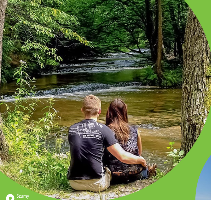
Shumy w rezerwacie „Nad Tanwią”