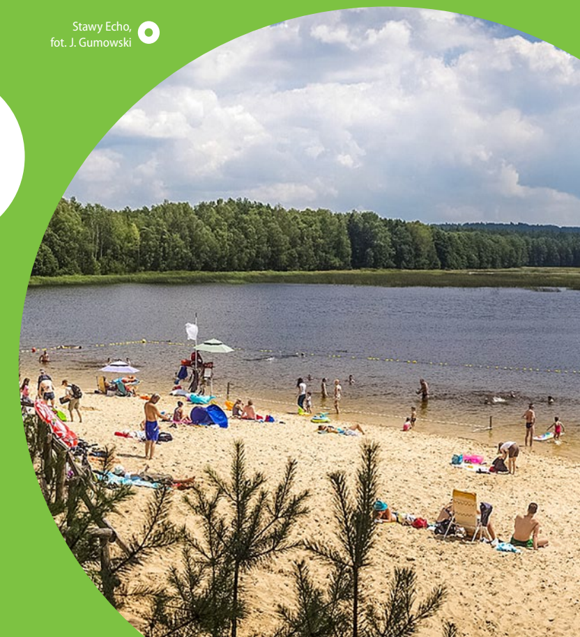
Stawy Echo

objętych ochroną rezerwatową. Jeden ze stawów, przylegający do zalesionej wydmy, pełni rolę kąpieliska. Stawy Echo wchodzi w skład Ostoi Konika Polskiego – na 180 ha koniki żyją niemal w stanie dzikim, jedynie zimą są dokarmiane. Kilka kilometrów na południe, we Floriance, znajduje się Izba Leśna powstała w oparciu o zabudowania leśniczówki z 1830 r.