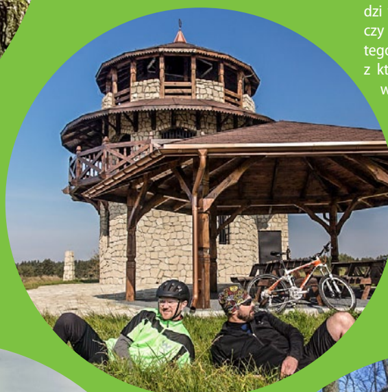
Wieża widokowa w Suścu

biórą początek ścieżki poznawczej. Dotrzemy stąd m.in. na Bukową Górę – wspaniały punkt widokowy, z którego można podziwiać panoramę roztoczańskich pól. Symbolem parku jest konik polski.